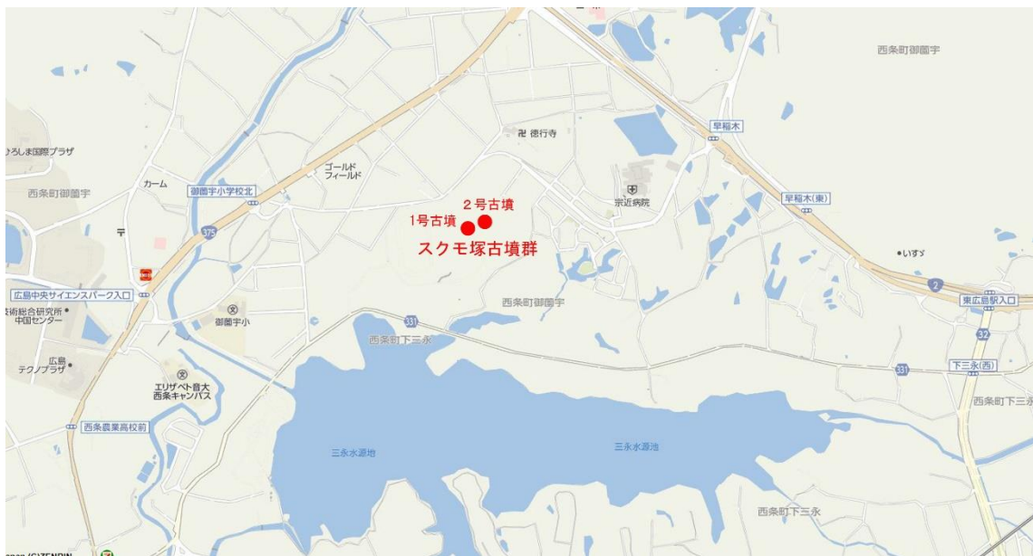
(スクモ塚1・2号古墳、広島大学西条研修センター宿舎棟裏山)