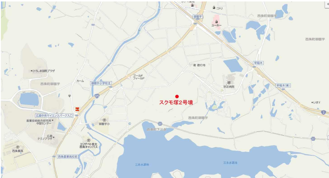
長者スクモ塚第1号古墳、広島大学西条研修センター宿舎棟裏山